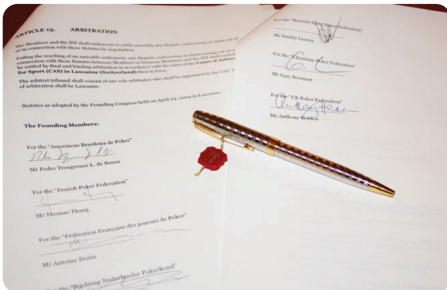
LEFT: Gary Bowmans pen was used to make the signing of the IFP historic agreement